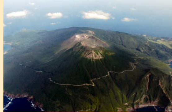
口永良部島 南側上空から撮影 第十管区海上保安部の協力による

噴火警戒レベルとは、噴火時などに危険な範囲や必要な防災対応を、レベル1から5の5段階に区分したものです。各レベルには、火山の周辺住民、観光客、登山者等のとるべき防災行動が一目で分かるキーワードを設定しています(レベル5は「避難」、レベル4は「避難準備」、レベル3は「入山規制」、レベル2は「火口周辺規制」、レベル1は「平常」)。対象となる火山が噴火警戒レベルのどの段階にあるかは、噴火警報等でお伝えします。